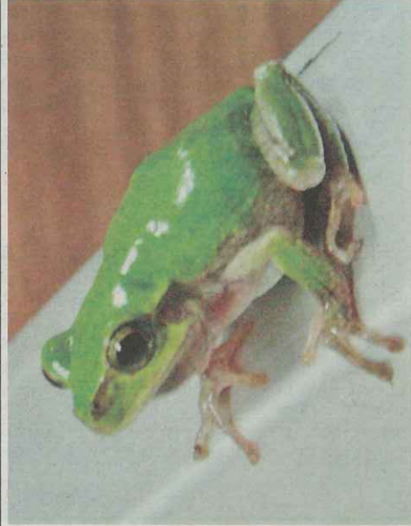
ニホンシマガエル

の報告が相次ぎ、拡大阻止に失敗したとの見方が出ている。30日からは連休で帰省ラッシュが始まる。ウイルスに感染した鳥のふんなどを踏んだ靴やタイヤで人々が動き回る事態も予想され、当局は感染確認地域の農場などに近づかないよう求めている。 H5N8型は、中国で流行しているH7N9型とは異なるタイプ。ただ渡り鳥が媒介